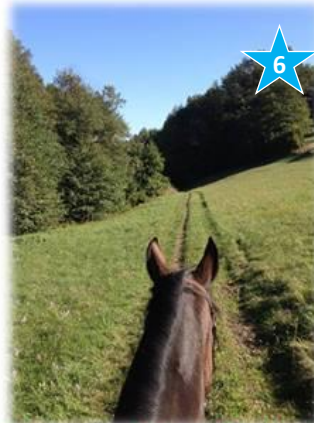
Wiesenweg hinter Groisbach

Königliches Herbstwetter mit Pferdemodel „Socke“.