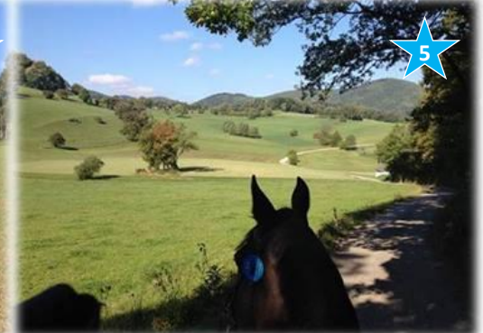
Blick Richtung Kreith