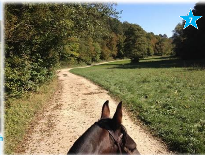
Bachweg nach Wiesenweg